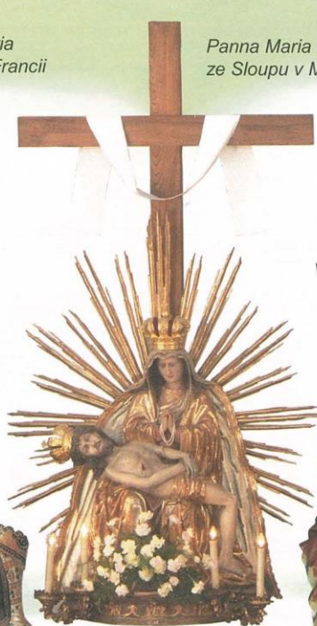
Panna Maria Bolestná ze Sloupu v Mor. krasu