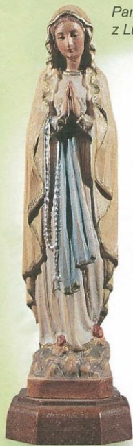
Panna Maria z Lurd ve Francii