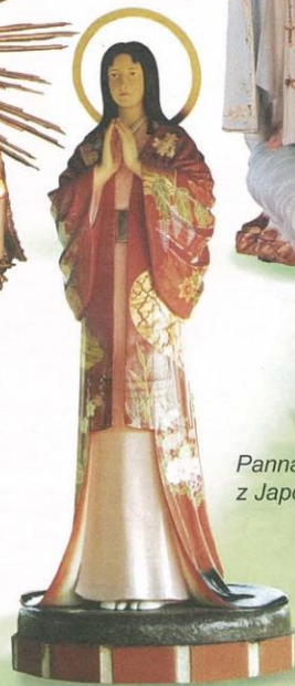
Panna Maria z Japonska