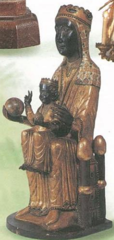
Panna Maria z Montserratu ve Španělsku